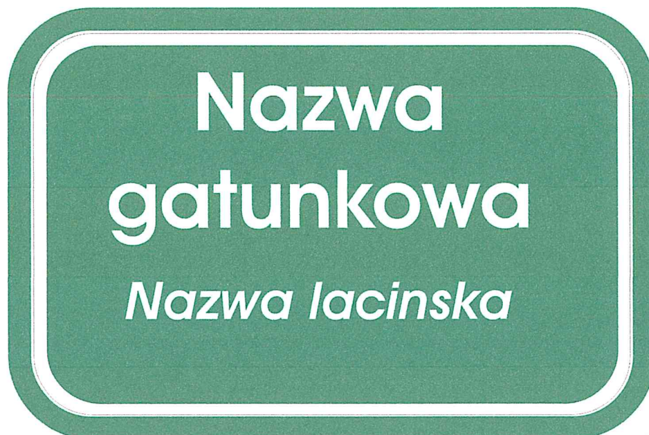
Przykładowa grafika etykiety